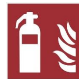
Standort Feuerlö- scher