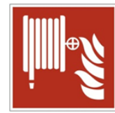
Standort Lösch- schlauch