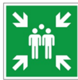
Hinweis auf Sammel- platz