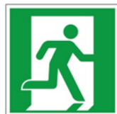
Fluchtweghin- weis 2